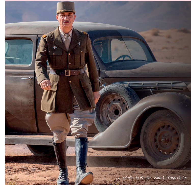
La bataille de Gaule - Film 1 : l'âge de fer